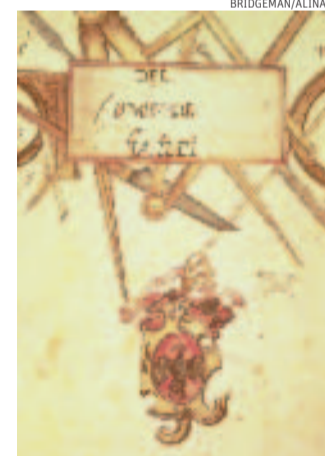
«Le operazioni del compasso geometrico e militare» (1640-1660 circa), frontespizio di una copia manoscritta di Galileo Galilei conservata nella Biblioteca Nazionale Centrale di Firenze

Dove Einstein vede, sostanzialmente, un caso di psicopatologia intellettuale, Panofsky individua un «paradosso», legato a un conflitto fra paradigmi scientifici. Keplero non era certo più «moderno» di Galileo, essendo influenzato dall'animismo rinascimentale e dalla mitica numerologia pitagorica; non era dunque privo di pregiudizi, ma essi erano di natura diversa. Anche Keplero era con-